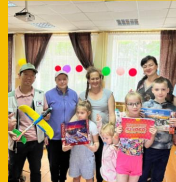
주거 지원 Housing Support