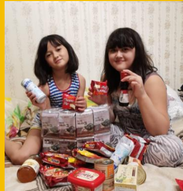
생활 지원 Lifestyle Support