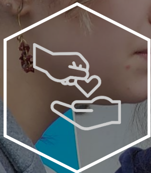
공공요금 캠페인 전개