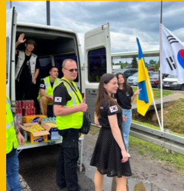
의료 지원 Medical Support