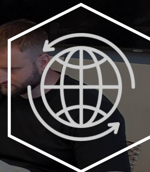
ODA 국제개발협력 프로젝트 추진