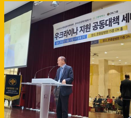
기업 연결 Corporation