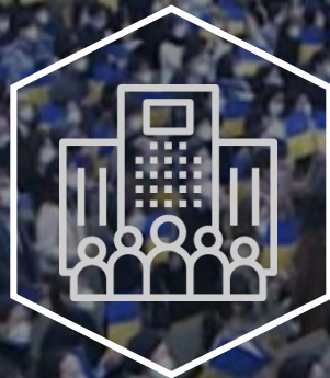
Announcement of Top 100 Humanitarian Companies