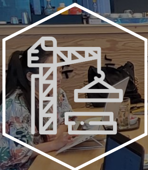
전후복구 마스터 플랜 설계