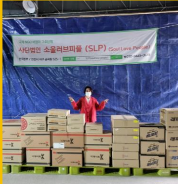
물품 지원 Supplies Support

우리의 활동은 3개의 축으로 조건 없는 인도주의 활동과 재건을 위한 자원을 동원하여 희망을 주는 강력한 연대를 이루어 가는 것이다. Our three pillars of our activities is to form a strong solidarity that gives hope by mobilizing resources for unconditional humanitarian activities and reconstruction