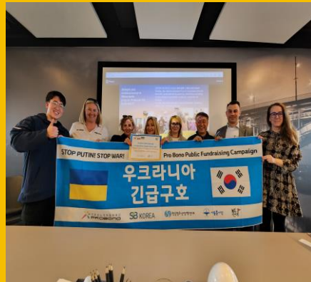
단체 연결 Group