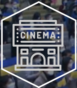
Peace Film Festival