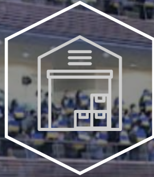
Establishment of European Logistics Warehouse System