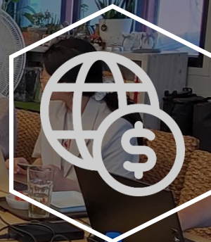
한·우 공공경제 포럼 확대