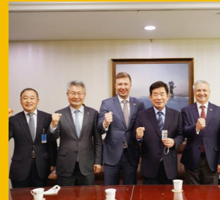
정부 연결 Government