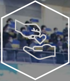
Public Fundraising Campaign