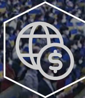
Kor-Ukr Public Economic Forum Expansion