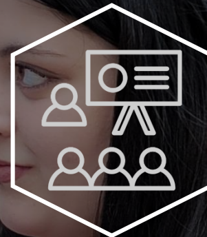
세계평화 청년포럼 개최