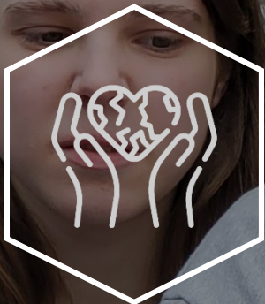
인도주의 물품지원 확대