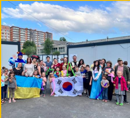
개인 연결 Personal