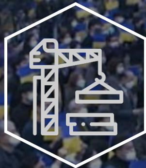
Plan Post-war Restoration Master Plan