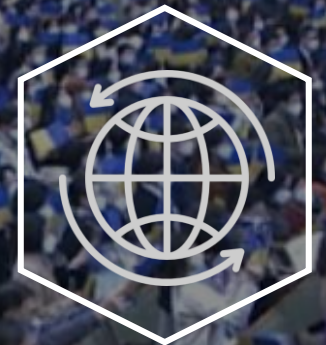
Launch ODA Global Development Cooperation Project