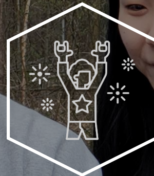
글로벌 평화 콘서트