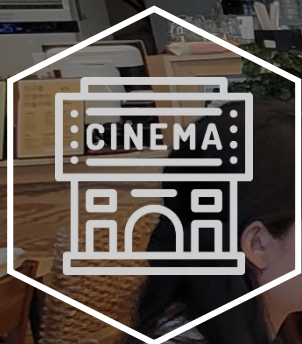
평화를 위한 영화제