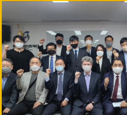
기관 연결 Organization