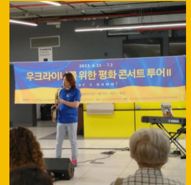
문화 지원 Cultural Support