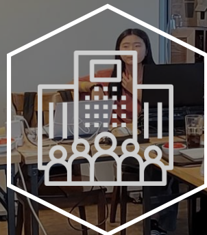
인도주의 100대 참여기업 발표